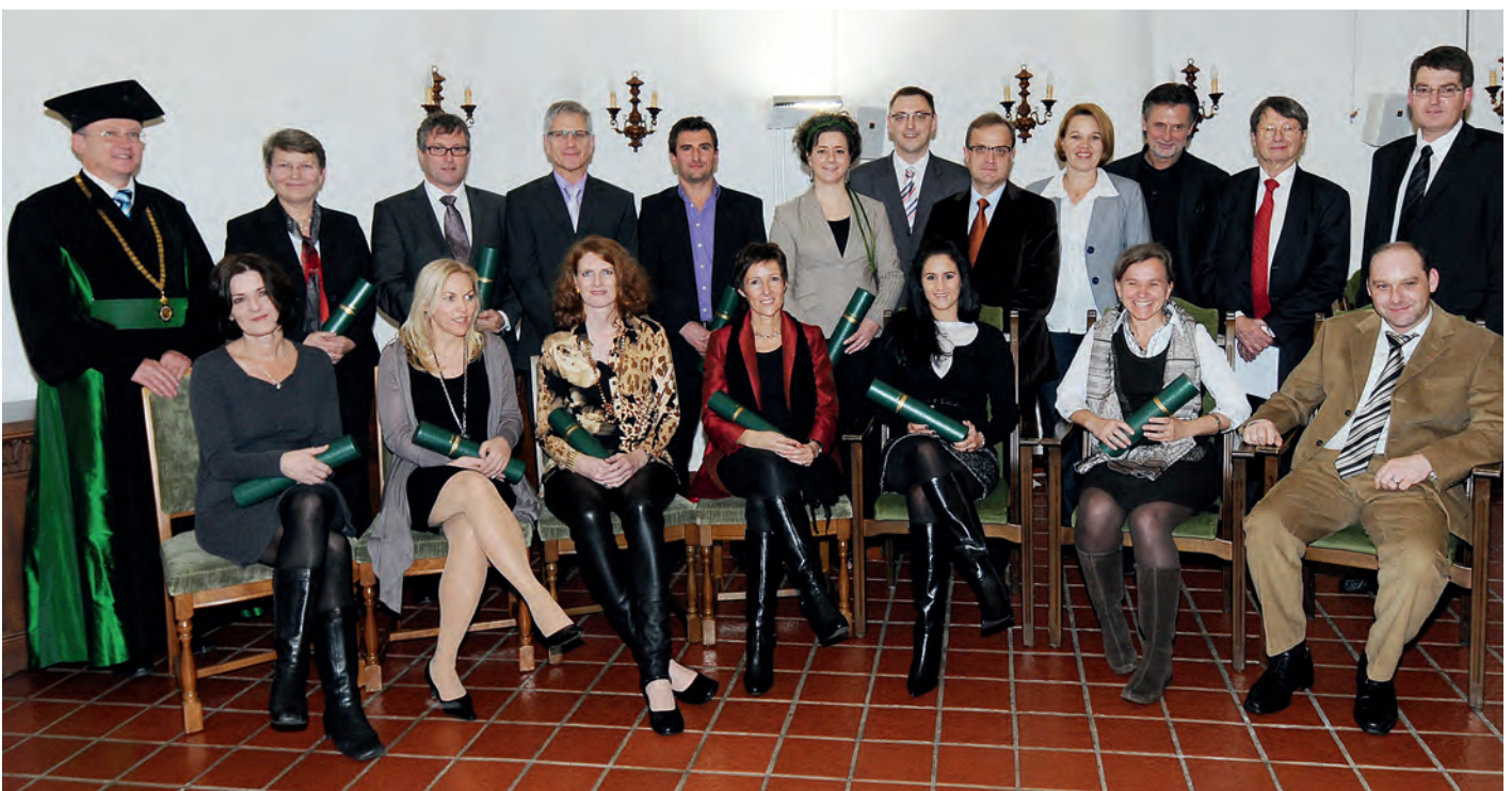
13 StudentInnen absolvierten erfolgreich das postgraduale Masterprogramm Public Health in Schloss Hofen.

Nach so vielen wertschätzenden Beiträgen schien es mir an der Zeit, den Blick auf den Anfang und das Ende des Universitätslehrgangs zu richten. Dass das schwierige Projekt überhaupt auf den Weg gebracht werden konnte, ist allein der visionären Kraft und dem Einsatz von Alt-Landesstatthalter Hans-Peter Bischof zu danken, der mit uns gemeinsam auch dessen erfolgreichen Abschluss gefeiert hat.